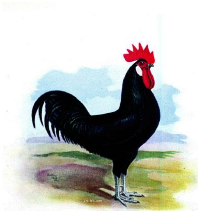
GALLO CASTELLANA NEGRA