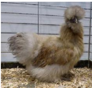
Sedosa perdiz blanca dorada

El CES-V tiene reservas sobre las 2 últimas razas y ha pedido fotos a Francia.