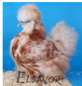
Sedosa blanca moteada en rojo