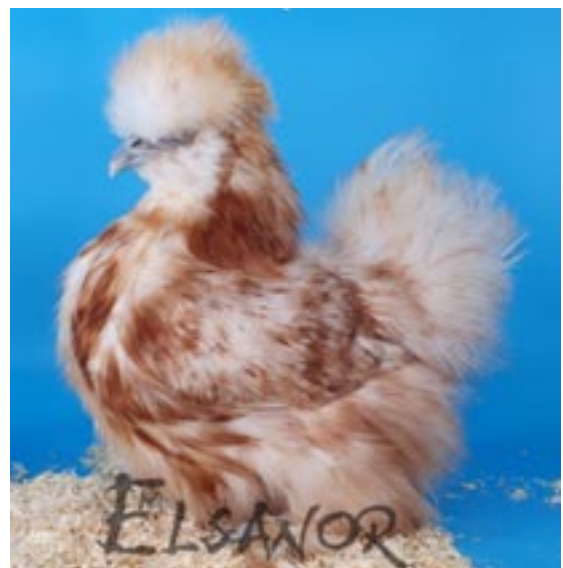
Poule soie blanc panaché rouge