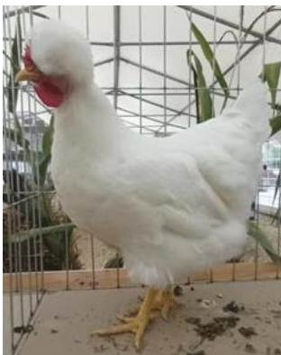
Moñuda blanca de Sombor

En la reunión internacional de jueces de Jagodina se presentaron varias razas locales: - Sandjak cantora, Serbia, Macedonia del Norte, conocida como Duganjini en Kosovo - Cantora Sandjak, Serbia, Macedonia del Norte, conocida como Duganjini en Kosovo - Cantora Kosovo (reconocida), Kosovo - Piklajka, Kosovo (gallina moñuda, no cantora) - Gallina crestada Posavina, Croacia (reconocida). Las gallinas moñudas de Sombor estuvieron presentes en la exposición EE de Brno en muy buena calidad. ¿Cuál es la diferencia entre las dos y la Trabzon Gugullu? ¿No tienen el mismo aspecto?