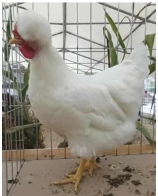
Poule huppée de Sombor blanche

- Poule huppée de Posavina, Croatie (reconnue). Les Poules huppées de Sombor étaient présentes à Brno lors de l'exposition EE en très bonne qualité. Quelle est la différence entre les deux et les Trabzon Guggullu ? N'ont-elles pas le même aspect ?