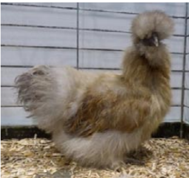
Poule soie perdrix blanc doré

La CES-V se montre réservée sur ces 2 dernières races et demande à la France des photos. ce qui a été fait.