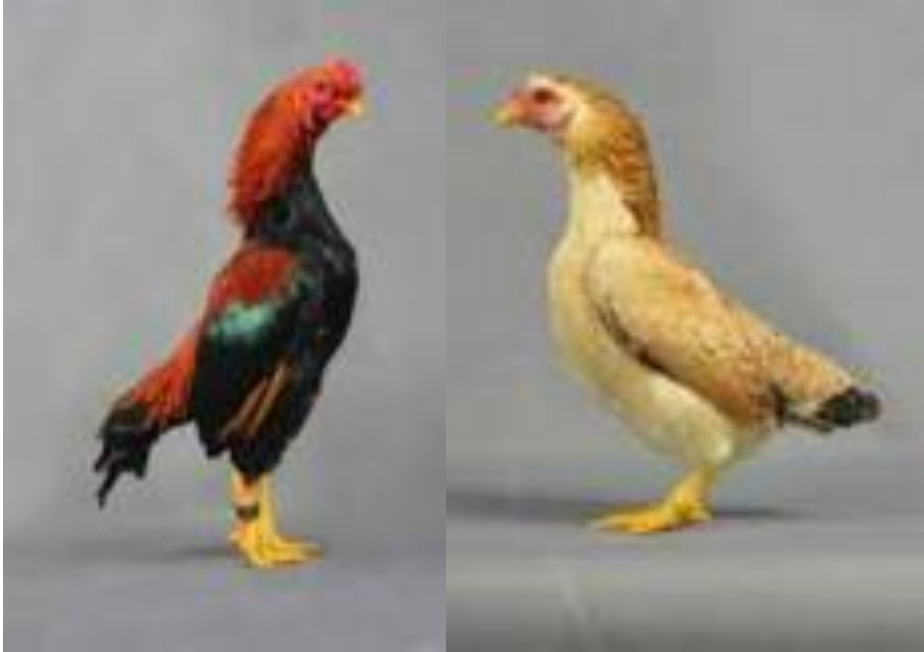
Pareja de tosa-Chibi

Numerosas razas y variedades están en proceso de reconocimiento. La lista es larga.