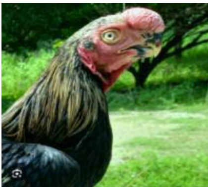
Asil pico de loro

En Turquía, el Asil de pico de loro y el Shamo de cuello desgreñado están cada vez más de moda. Son hipertipos a evitar.