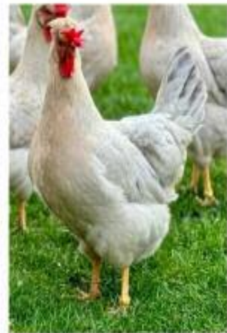
Poule Legbar huppée saumon coucou gris perle doré