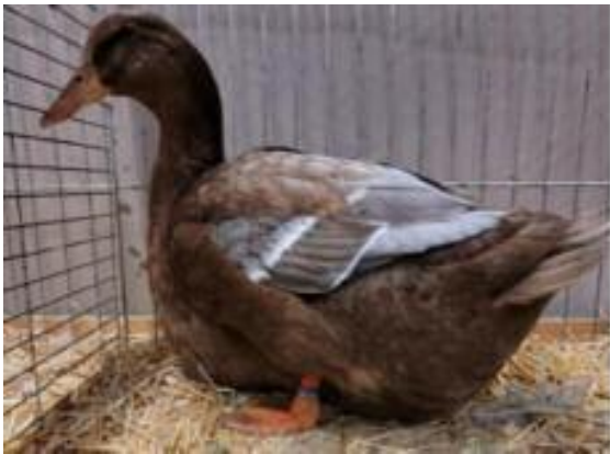
Pato Rouen Inglés expuesto en Erfurt – Alemania.

Italia ha enviado modificaciones del estándar para Ancona y Livorno, en inglés. No están autorizados a cambiarlo por su cuenta; está estipulado en el contrato. Entonces, ¿qué hacemos? ¿Tenemos que comprobar los cambios o simplemente archivarlos? De todos modos, estas solicitudes se examinan y se aceptan comentarios justificados: se está preparando un estándar digital alemán. Aparecerá en Otoño. En la exposición de Erfurt (Alemania), un pato de Rouen inglés estaba «inclinado hacia delante». Una posición muy extrema. Recordatorio: según la norma, el vientre no debe tocar el suelo.