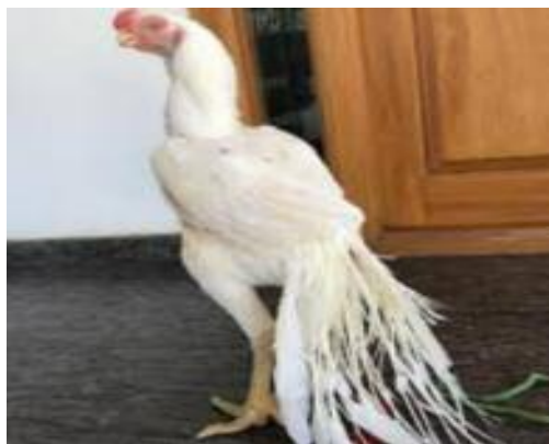
Shamo de cuello tembloroso como la paloma