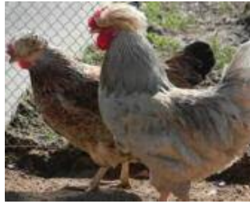
Gugullu de Trabzon