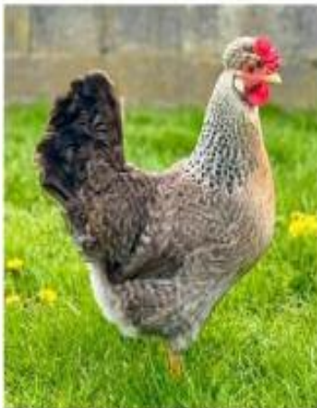
Poule Legbar huppée saumon coucou doré clair

En France, il y a un club de la Legbar huppée (24 adhérents pour l'instant). On ne sélectionne que les variétés huppées pondant des œufs bleus (voir ci-dessous)