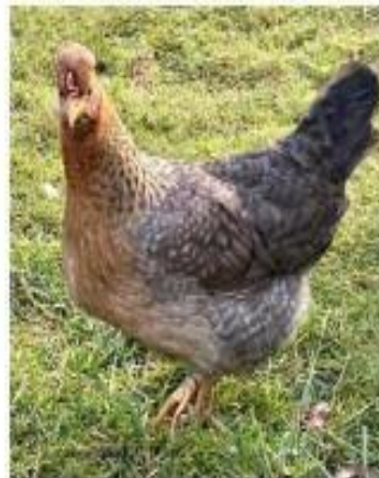
Poule Legbar huppée saumon coucou doré